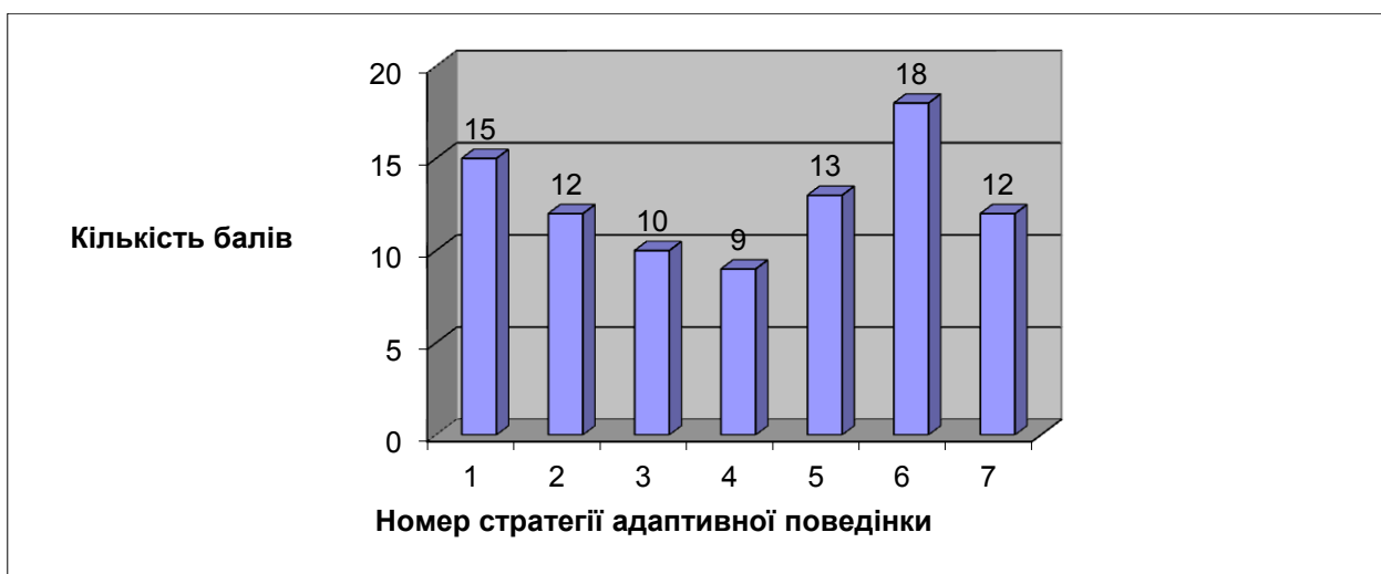
Рис. 5.2 – Діаграма ваги стратегій адаптивної поведінки студентів